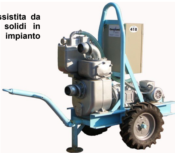
Elettropompa Mod. GEO EP4 W