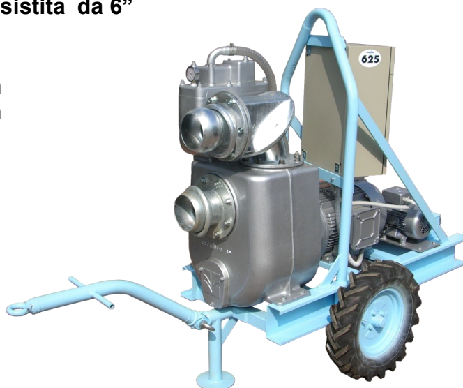
Elettropompa Mod. GEO EP6 W 1450rpm