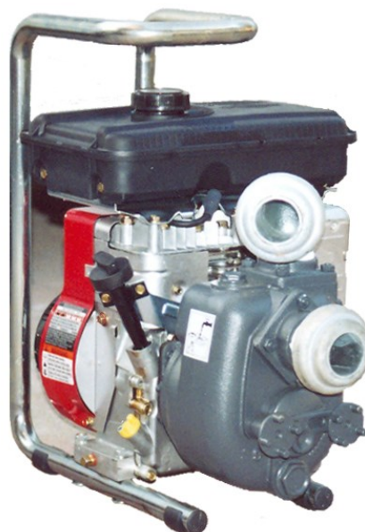
Motopompa Mod. GEO MP2 W