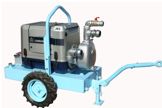
Motopompa Mod. GEO MP3_S_Sileo 1400

Adatta per Stazioni di Rilancio o Gruppi di Spinta