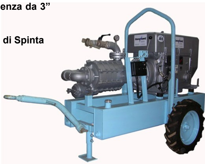
Motopompa Mod. GEO MP3_SH_Hatz 4

Adatta per Stazioni di Rilancio o Gruppi di Spinta