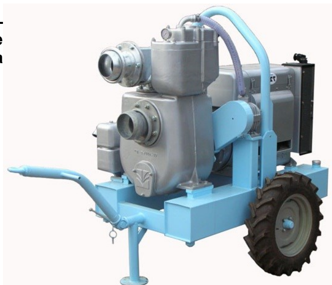
Motopompa Mod. GEO MP6_S W