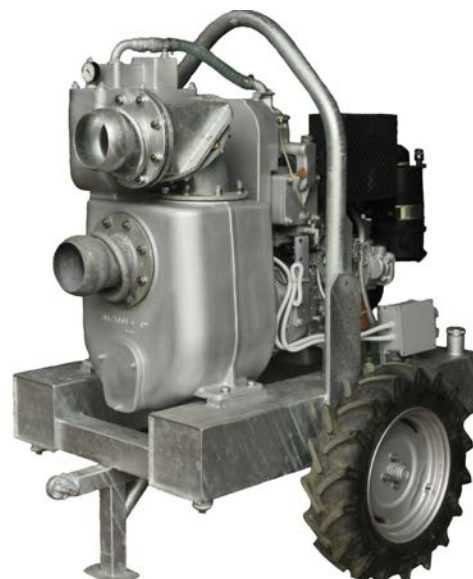
Motopompa Mod. GEO MP6 W