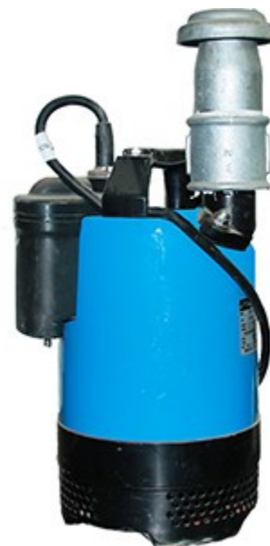
Pompa Sommergibile Mod. GEO LB800A