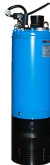
Pompa Sommergibile Mod. GEO LH230W

Pompa Sommergibile da 2" per il pompaggio di acque PULITE, adatta al DRENAGGIO con POZZI.