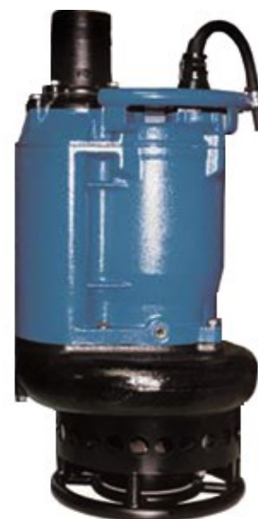
Pompa Sommergibile Mod. GEO KRS2150

Passaggio max. corpi solidi \varnothing 30 mm.